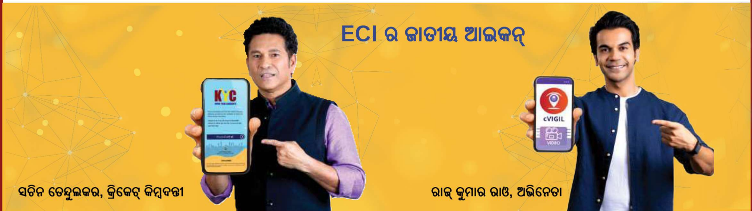
ସଚିନ ଚେନ୍ନୁଲକର, କ୍ରିକେଟ୍ କମ୍ପ୍ୟୁଟରୀ