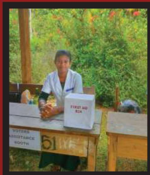
ମତଦାନ କେନ୍ଦ୍ରରେ ଚିକିତ୍ସା ସୁବିଧା ଉପଲବ୍ଧ

ଭୋଟର ଆବଶ୍ୟକ କରୁଥିବା କୌଣସି ବି ସହାୟତା ପାଇଁ ମତଦାନ ଦିନ ହେଲେ ଡେୟାରରେ BLO ଉପଲବ୍ଧ ହେବା ଆବଶ୍ୟକ ଏବଂ ଭୋଟରମାନେ ନିଜ ନିଜ ମତଦାନ ବୁଥରେ ସ୍ୱାଗତ କରାଯାଉଥିବା ଭଳି ଅନୁଭବ କରିବା ଦରକାର ।