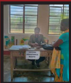
ଭୋଟର ସହାୟତା କେନ୍ଦ୍ରରେ BLO